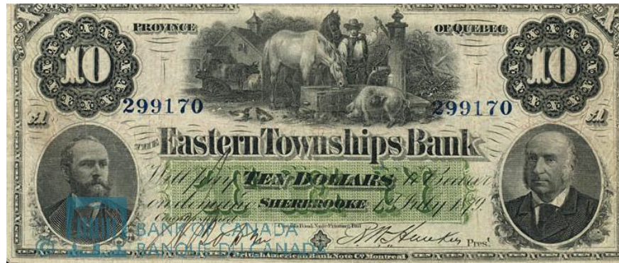
Canada, Eastern Townships Bank, 10 Dollars: July 1, 1879. National Currency Collection, Bank of Canada Museum.