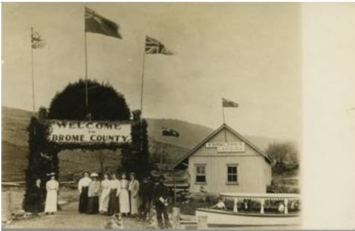
Knowlton Landing. Postcard Collection BCHS8004.