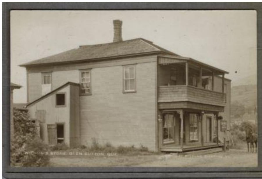
Wilson's Store Glen Sutton. BCHS8004-S1-D5-P148

Le SHCB dispose également d'une collection de fichiers contenant des photos et des documents relatifs aux villages. Ces fichiers classés par ordre alphabétique contiennent souvent des photos d'entreprises locales.